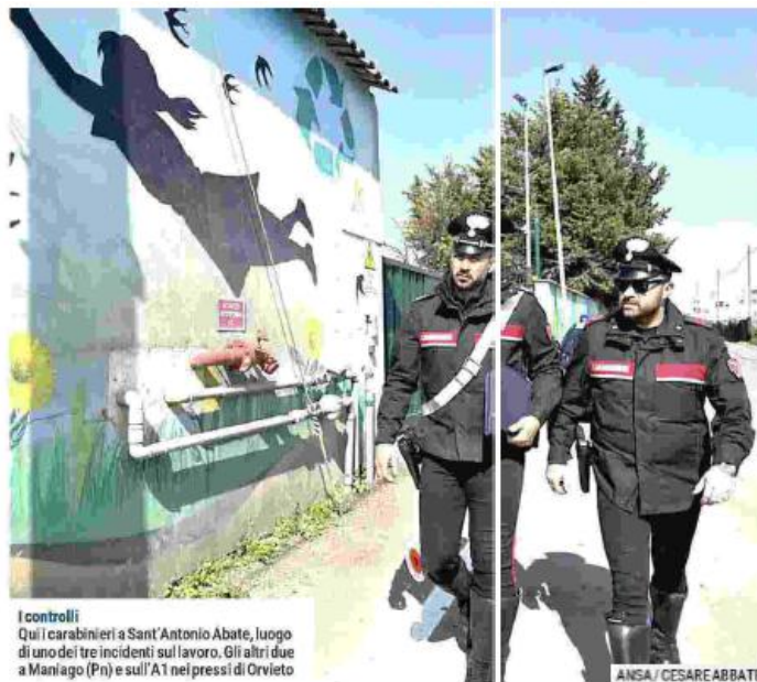
I controlli Qui i carabinieri a Sant'Antonio Abate, luogo di uno dei tre incidenti sul lavoro. Gli altri due a Maniago (Pn) e sull'A1 nei pressi di Orvieto